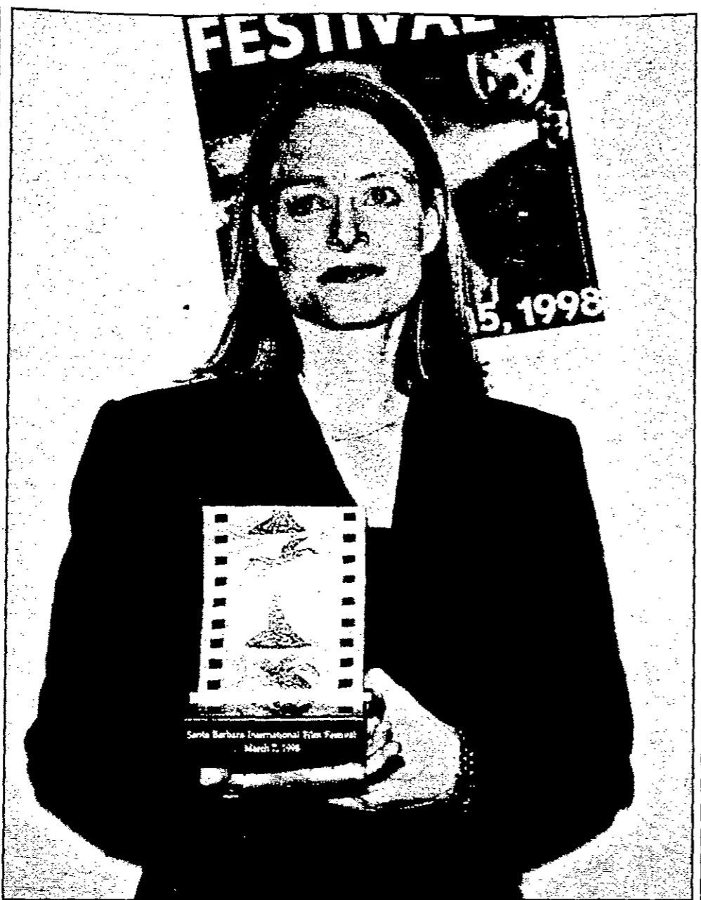
اقام مهرجان مساندا وبرابرا السينمائي حفل تكريم للنجمة والمخرجة الامريكيا جودي فوستره في مساندا برابرا بالفيرونيا.

الرياض - أف ب: ذكرت صحيفة اليوم السعودية أمس الاثنين ان ست عشرة طالبة سعودية لقين مصرعهن غرقا السبت الماضي في سيول اجتاحت الماكه... بسبب السيول!